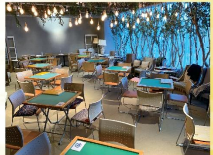
会場：クラシティ2階「Farm@」