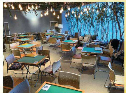
会場：クラシティ2階「Farm@」